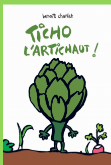
Ticho l'artichaut de Benoit Charlat