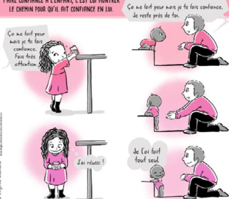
Illustration de Virginie Maillard - bougribouillons.com

FAIRE CONFIANCE À L'ENFANT, C'EST LUI MONTRER LE CHEMIN POUR QU'IL AIT CONFIANCE EN LUI.